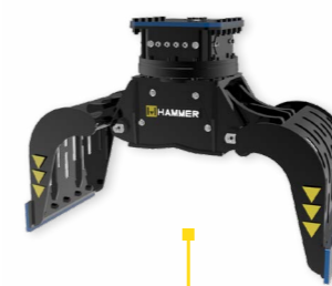
GR + CHELA STANDARD