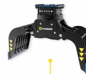
GR + CHELA DEMOLITION